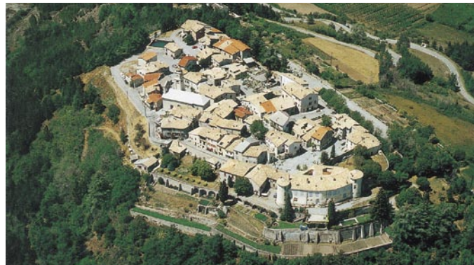
réalisation - impression - QUORISCAN - 04 92 79 97 17

Le château, ancienne demeure féodale, occupe toute la partie méridionale du coteau. Trois terrasses en amphithéâtre, soutenues par de hautes murailles, forment au vieil édifice une triple ceinture. La porte qui s'ouvre sur le village est du XVème siècle, dans le style de la Renaissance.