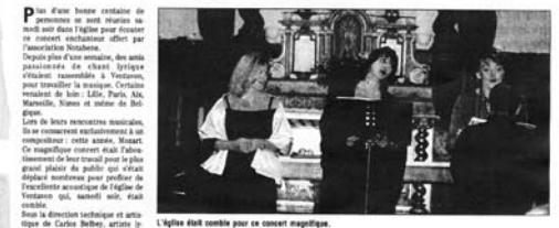
L'église était comble pour ce concert magistral.

LARAGNE-MONTÉGLIN Dédicace. Aux Femmes Trévères, autour de Birex - Laragne, nos pères assurent une maîtrise dédiée jeudi 19 août de 9 h 30 à 12 h devant l'office de tourisme. IV e rencontres musicales. "Au tour de l'Opéra Français", concert gratuit proposé par l'association "Nota Bene", le mercredi 11 août, à 21 h, à l'église.