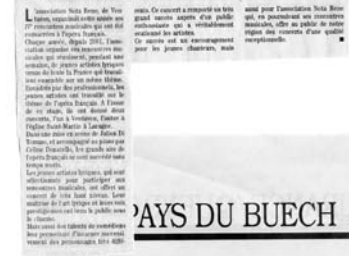
Un concert prestigieux pour l'association Nota Bene.

DU BUECH LARAGNE-MONTÉGLIN Succès pour un concert prestigieux