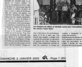
Les chanteurs ont obtenu un véritable succès avec l'interprétation des œuvres d'Opéra Italien.

VENTAVON "Nota bene" a bien fait les choses